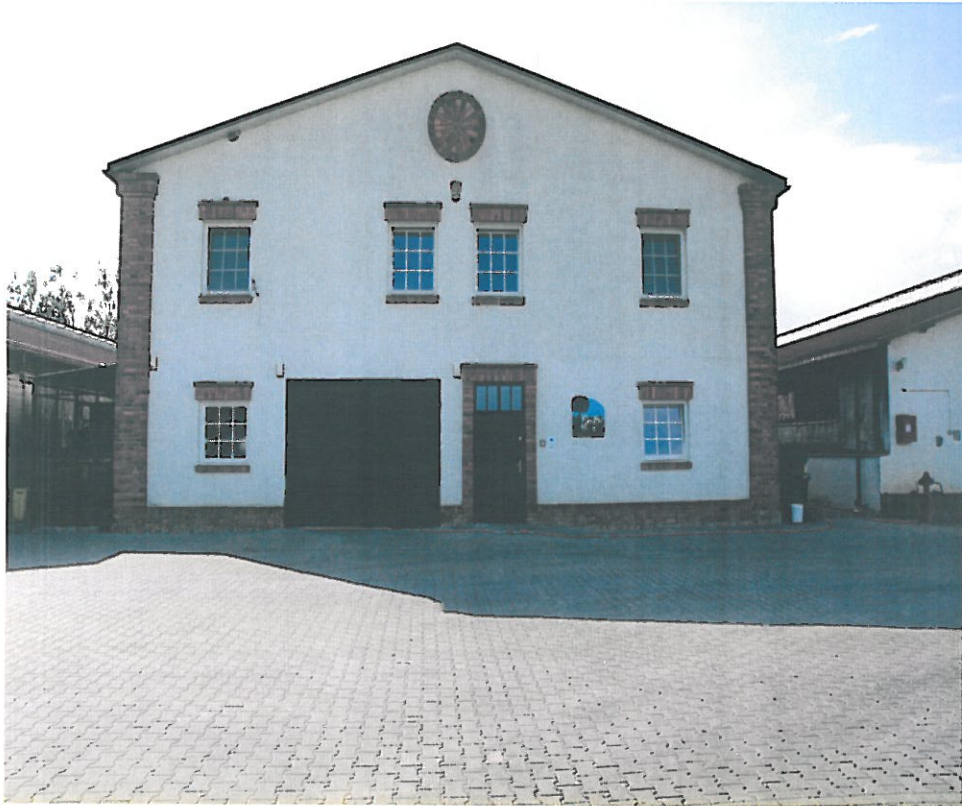
Ever Milk Sp. z o.o. - chów i hodowla bydła mlecznego